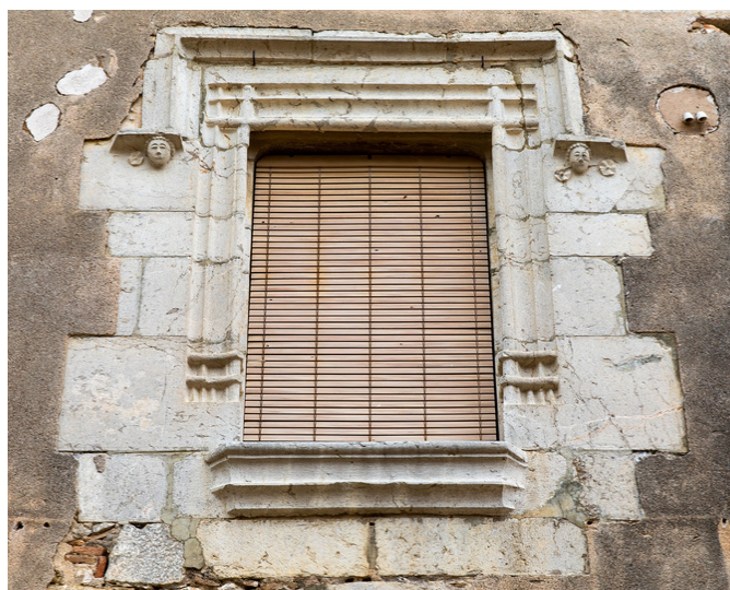
Finestra del Carrer Major - Bellcaire d'Empordà