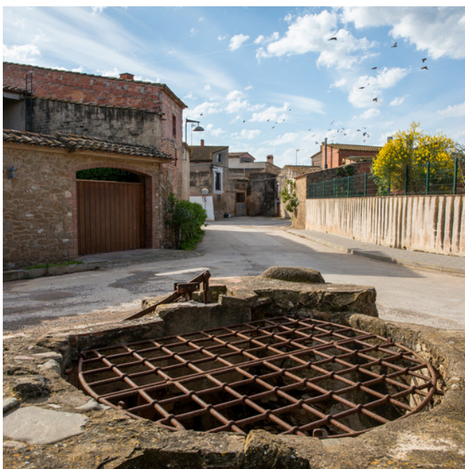
Pou dels Tres Corns - La Tallada d'Empordà