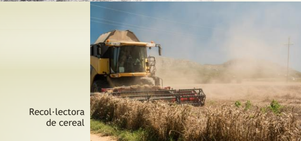
Recol·lectora de cereal