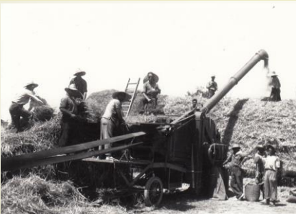
Màquina de batre